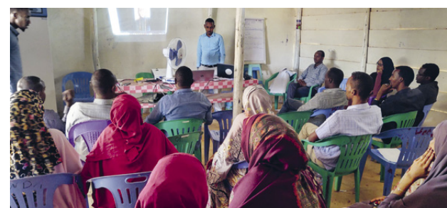
Workshop mit verschiedenen Stakeholdern