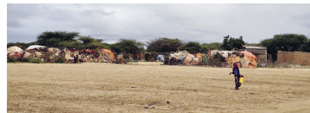
Eines der vielen Flüchtlingslager